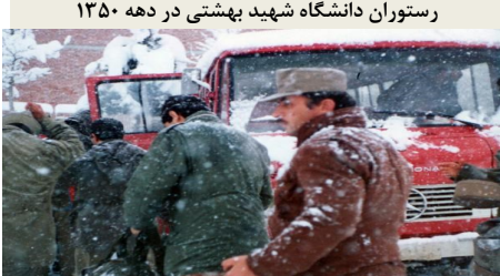
رستوران دانشگاه شهید بهشتی در دهه ۱۳۵۰